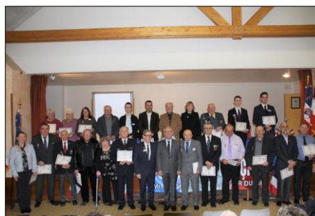
Titulaires des diplômes d'honneur et médailles de bronze

A noter : la prochaine assemblée générale du Souvenir Français aura lieu à Corbelin au cours du premier trimestre 2019